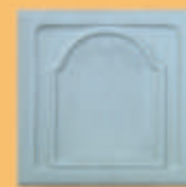
Placă "BIZANTIN" - AB12 -