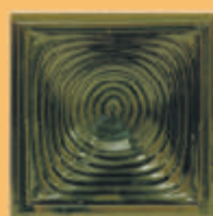
Placă "SCHUSSEL" - V12 -