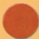
Capac - C12 -