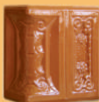
Stâlp "CRIZANTEMA" - B12 -