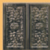
Placă "CORVIN" - V14 -