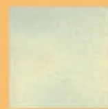
Placă "GLAT" - A25 -