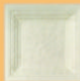
Placă "Ramă Roschman" - A25 -