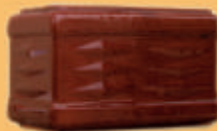
Colț cornișă - soclu - M12 -