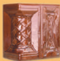
Stâlp "T" - M11 -