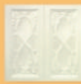
Placă "PĂPĂDIE DUBLĂ" - A21 -