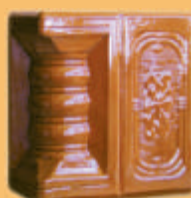
Stâlp "PANSEA" - B12 -