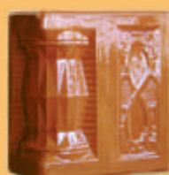
Stâlp "PĂPĂDIE" - B12 -