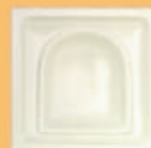
Placă "BIZANTIN ADÂNC" - A21 -