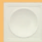
Placă "S2" - A21 -