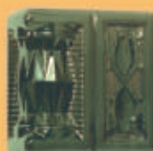
Stâlp "PĂPĂDIE" - V12 -