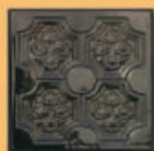
Placă "PANSELUȚĂ" - V14 -