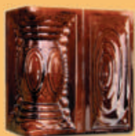
Stâlp "SCHUSSEL" - M12 -