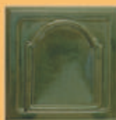
Placă "BIZANTIN" - V12 -