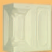
Stâlp "BIZANTIN" - A25 -