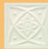
Placă "DIAMANT" - A21 -