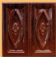
Placă "NOVA" - M12 -