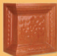
Stâlp "Ramă Roschman" - C12 -