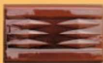
Laterală cornișă - soclu - M12 -