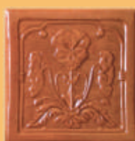
Placă "PANSEA" - C12 -