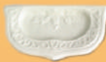
Scrumieră - A21 -