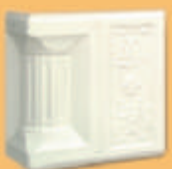
Stâlp "CORVIN" - A21 -