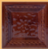
Placă "Ramă Roschman" - M12 -