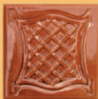
Placă "T" - C12 -