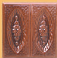
Placă "TRANDAFIR" - M11 -