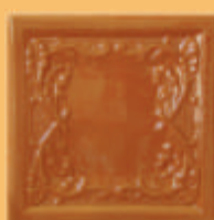
Placă "PĂPĂDIE" - B12 -