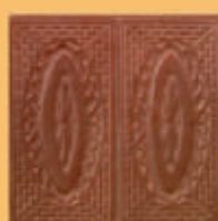
Placă "CORONIȚĂ" - M21 -