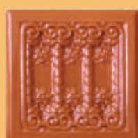
Placă "CRIZANTEMA" - C12 -

Piese ceramice din teracotă pentru alcătuirea sobelor de încălzit, gătit și a șemineelor. Fețele aparente au diferite modele, care înfrumusețează sobele și măresc suprafața de încălzire, fiind acoperite cu glazuri lucioase sau mate.